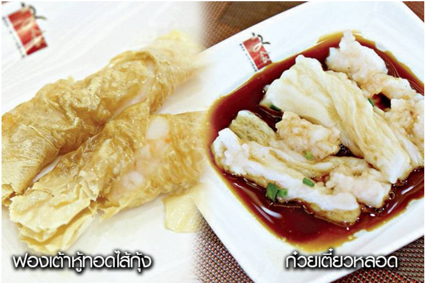
ฟองเต้าหู้ทอดไส้กุ้ง